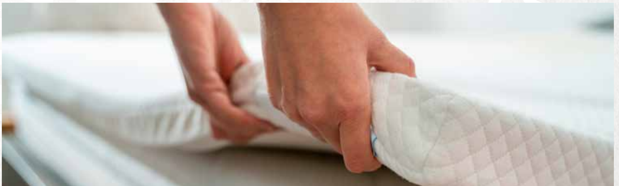
814 MEMO FOAM / H 7 CM