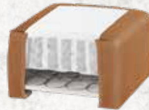
8223 (23 CM) / 8127 (27 CM) KENIA LEDER - WALNUT