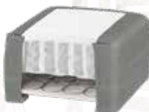
8223 (23 CM) / 8127 (27 CM) KISS STOFF - LIGHT GREY