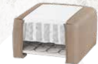
8223 (23 CM) / 8127 (27 CM) KENIA LEDER - TAUPE