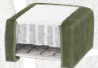
8223 (23 CM) / 8127 (27 CM) VELOURS - HUNTER