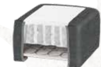
8223 (23 CM) / 8127 (27 CM) KISS STOFF - GRAPHITE