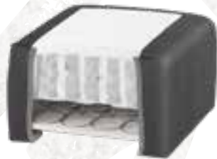
8223 (23 CM) / 8127 (27 CM) KENIA LEDER - ANTHRACITE