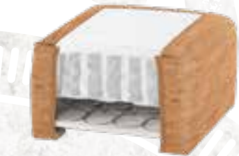
8223 (23 CM) / 8127 (27 CM) KORK - NATUR