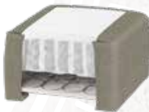
8223 (23 CM) / 8127 (27 CM) KISS STOFF - NATURAL