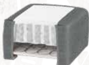
8223 (23 CM) / 8127 (27 CM) KISS STOFF - GREY