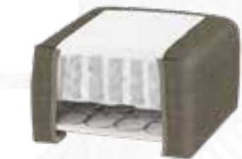
8223 (23 CM) / 8127 (27 CM) KISS STOFF - ARMY