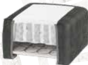
8223 (23 CM) / 8127 (27 CM) VELOURS - DARK GREY