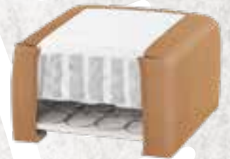
8223 (23 CM) / 8127 (27 CM) KENIA LEDER - COGNAC