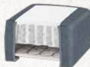
8223 (23 CM) / 8127 (27 CM) KISS STOFF - BLUE