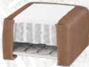
8223 (23 CM) / 8127 (27 CM) KENIA LEDER - BROWN