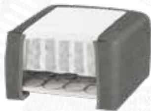
8223 (23 CM) / 8127 (27 CM) KISS STOFF - STONE