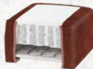
8223 (23 CM) / 8127 (27 CM) VELOURS - COPPER