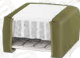
8223 (23 CM) / 8127 (27 CM) KENIA LEDER - OLIVE